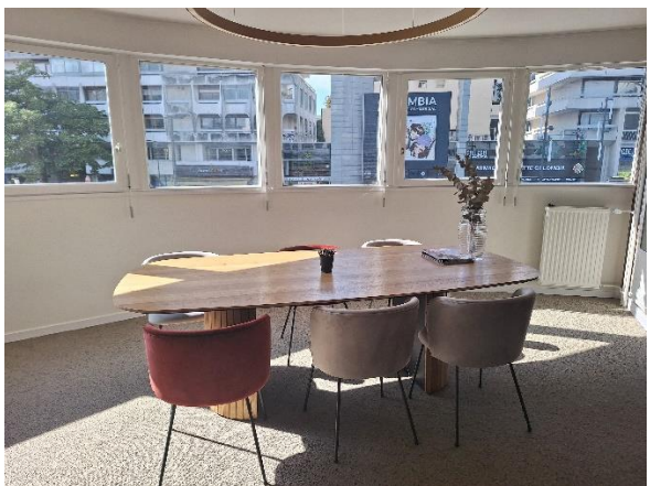
Salle de réunion