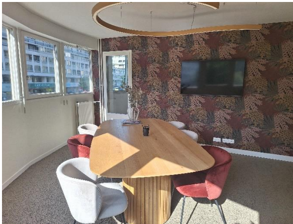
Salle de réunion